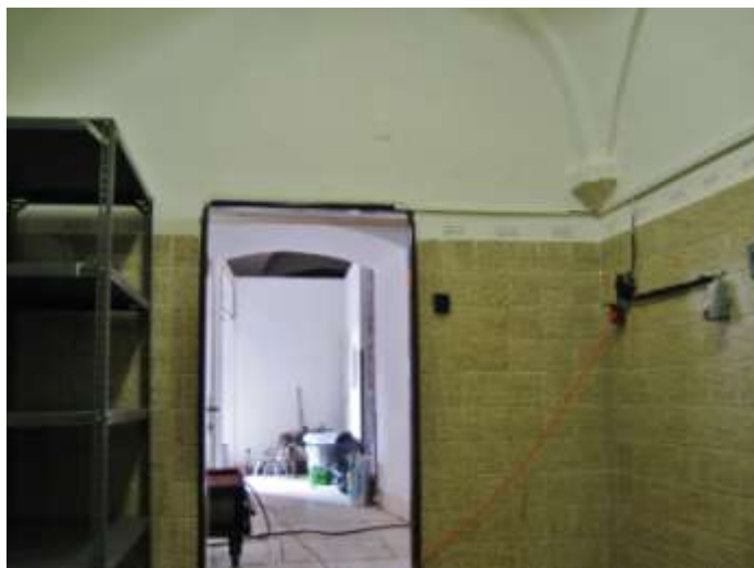
Vstup hlavním vchodem do klášterní chodby (za příčkami jsou vidět stropní klenby). Na obr. vpravo tentýž vstup průhledem z „Klášterní kavárny“ (v minulosti „přípravna masa“)