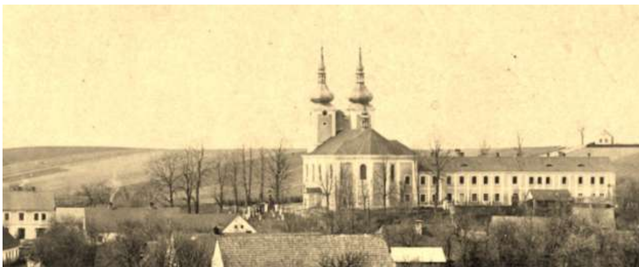
Jiná historická fotografie – sedm oken zprava v patře – klauzura řádových sester