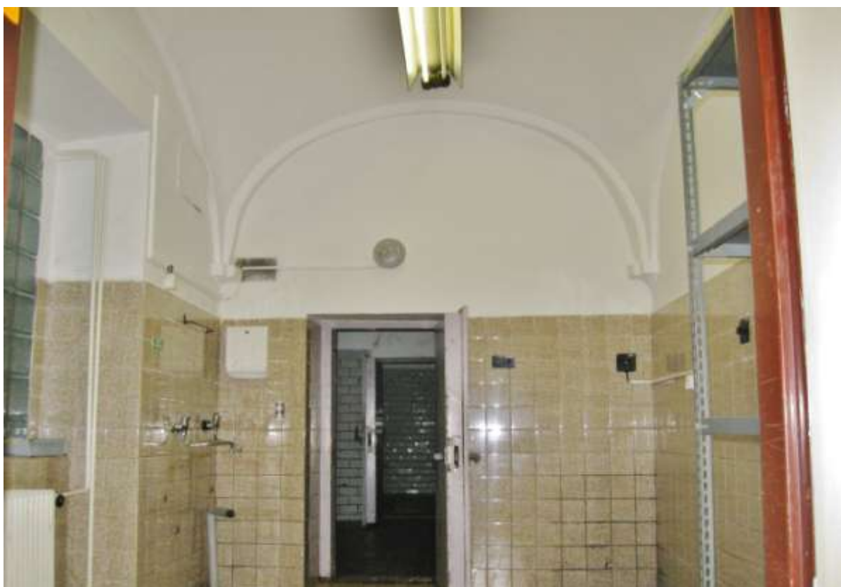
Pohled do budoucí kavárny (?) - za dveřmi dvojice chlad. boxů – po adaptaci zázemí kavárny, případně WC pro hosty přístupné z klášterního dvora...